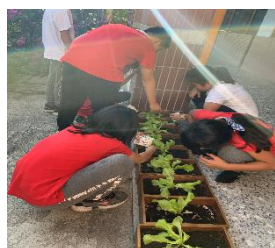
週五固定行程 澆水