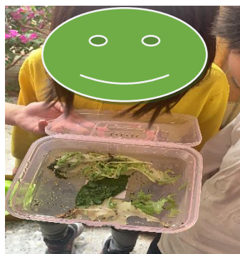
無毒保證-抓到滿滿的菜蟲