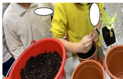
換盆兼補充養分 (家長提供的黑豆渣)