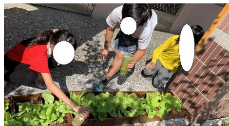
以營養午餐的果皮、蔬菜 葉梗打成的天然肥料。