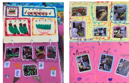
成果發表-愛的分享