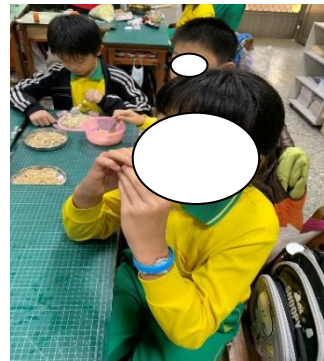
自己種的奶油萵苣，就是好吃。