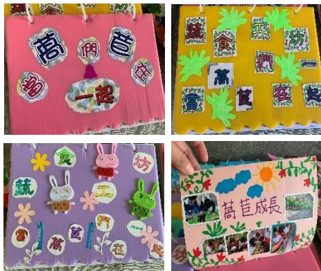
成果發表-小書封面