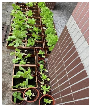
低碳飲食-教室外的小菜園