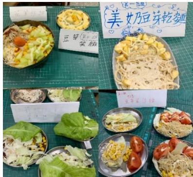
二度採收 (在發豆芽小廚師活動時，一起入菜)