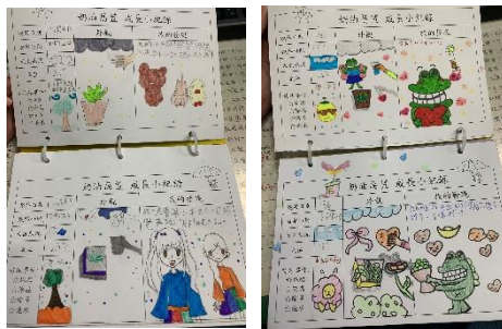
成果發表-生長紀錄表