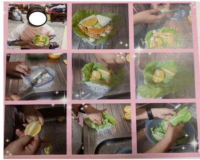
與家人分享，並共同製作佳餚。