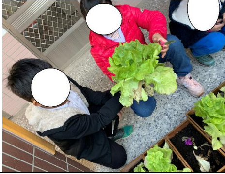
過了1個多月，總算可以採收囉！