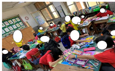
週五固定行程 觀察紀錄表&小書製作